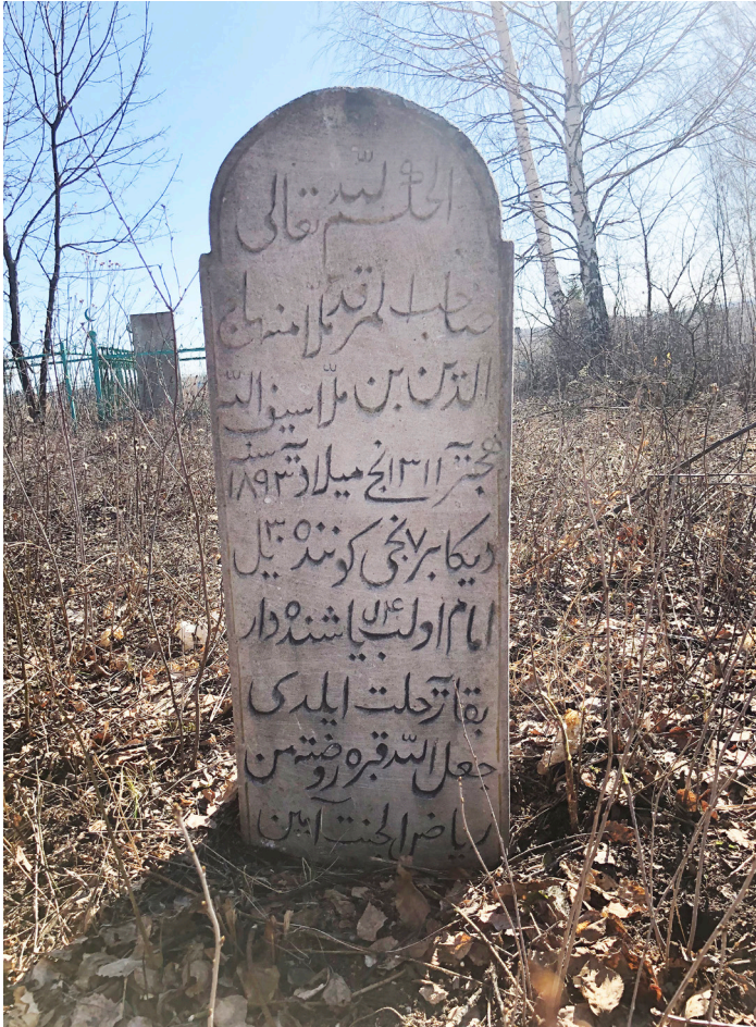
Минһажетдин Сәйфулла улының кабер ташы

ташъязда аның жәмәгәте Ләйләжамал Габделгалим мәзин кызының исеме уелган. Ләйләжамал абыстай 1892 елның 22 апрелдә (яғни, иреннән 1,5 ел алданрак) дөнья куйган. (Бу кабер ташында Габделгалим мәзиннең әтисе Нигъмәтулла мулла икәнлегә дә күрсәтелгән). Әлегә ядкярләрнең мәғлүматларын 2013 елның көзөндә И.Һадиев белән бергә теркәп алган идек. Бу кабер ташларының фоторәсемнәре һәм тулы текстлары