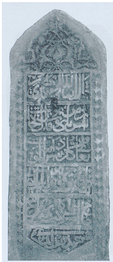
Минһажетдин Жәбәли Шигали зиратында өйрәнгән, Тенеш исемле кешегә куелган 1550 елгы ташгъзма истәлек

мәгърәкәдә шәһид улмыш чуашдур ки. Асты «тарихе һижрәт йөз кырыкда рабигъиль-әүвәлдә Әсәд кяфер кулындын шәһид булды, вә ма тәдри нәфсүн би-әйи ардин тәмүтү» 53 диб йазылган, рәсме госманийә вә пашаи рәсемдүр. Икенче ташда «Вә ма