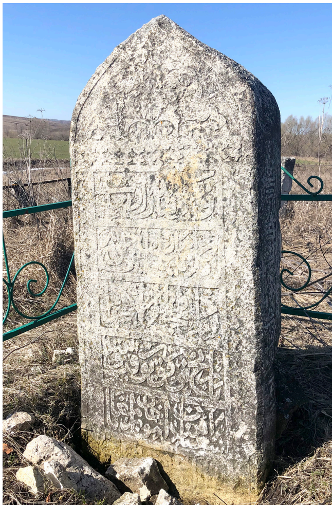
Бәчек авылы зиратындагы 1540 елгы кабер ташы

Сул ягында: Калә ән-нәби галәйһиссәлам әд-дөнъя сагаты фәжгальһа тагаты.