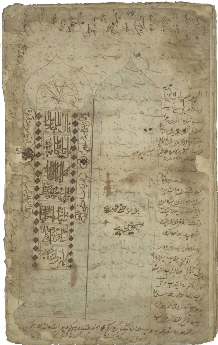
Бәчек авылы зиратындагы тарихи кабер ташының Минһажетдин Жәбәли ясаган рәсеме. 236 кәгазе